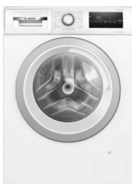
Pralka BOSCH WAN2425SPL 8kg 1200 obr EcoSilence Drive